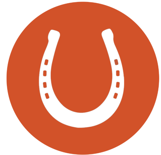
IJzer smeden als het koud is